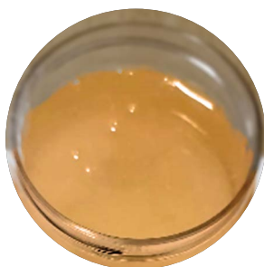
AL CONTACTO CON EL AGUA